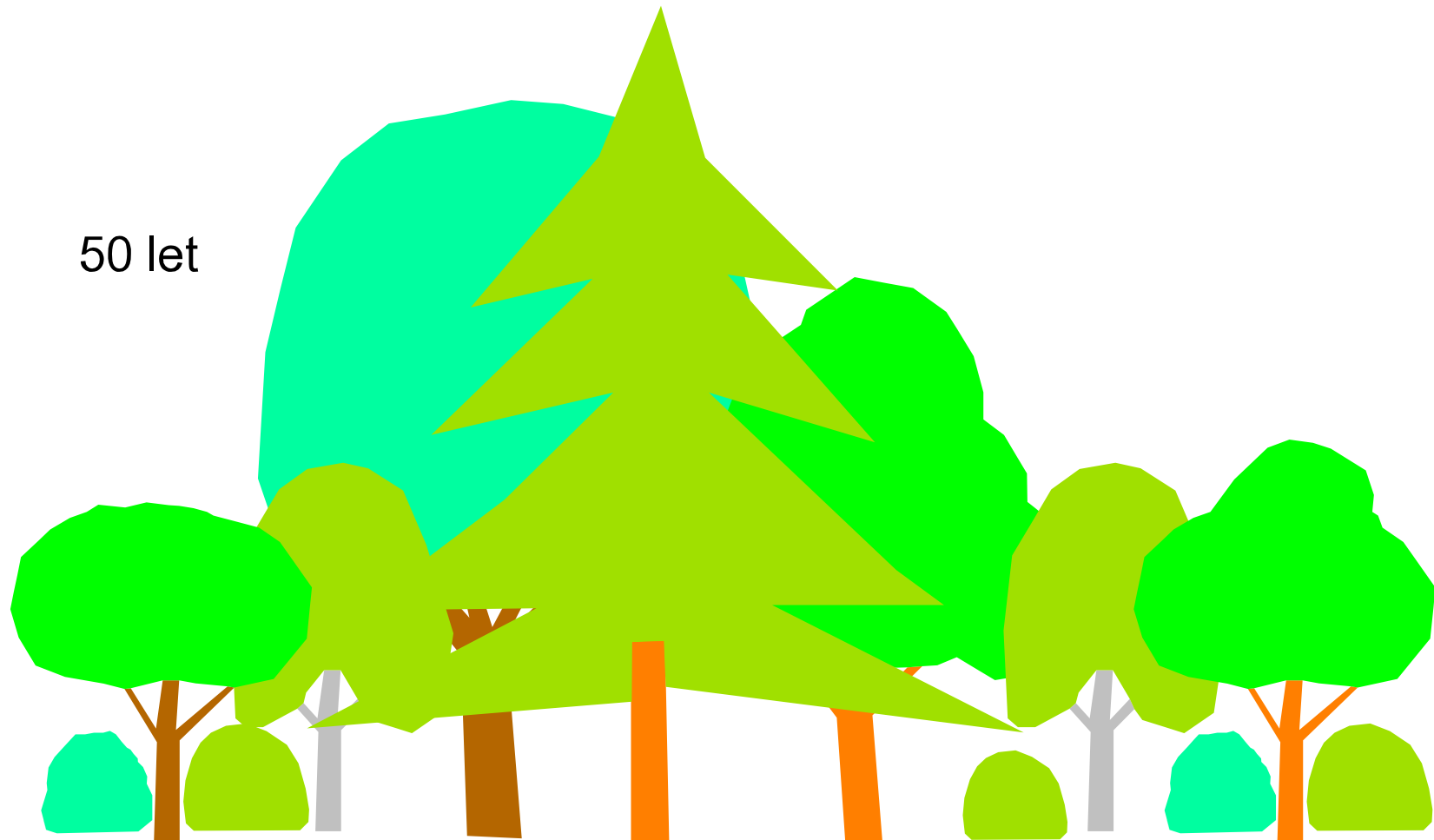
Zapojený porost po 50 letech, cílové dřeviny dominují a pionýrské dřeviny s keří tvoří lem výsadby